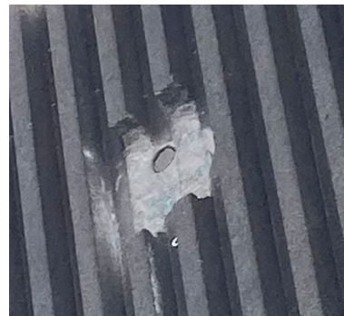
Ringnut Nr. 2 (Feld 53)