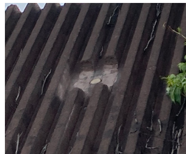
Ringnut Nr. 1 (Feld 22)