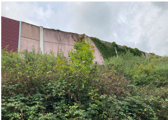
Seitenansicht km 135,1 (anliegerseitig)