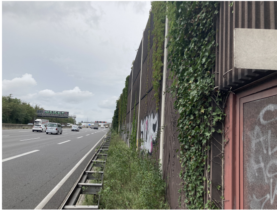
Seitenansicht km 135,1 (BW 5008 872 C)