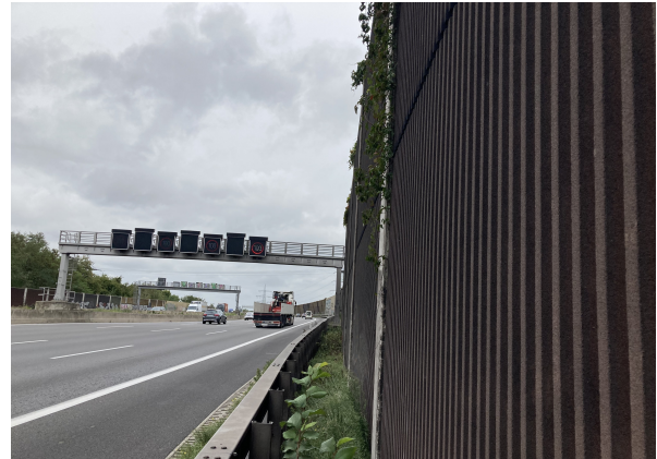
Seitenansicht km 134,9 (straßenseitig)