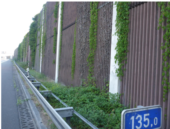
Seitenansicht km 135,0 (straßenseitig)